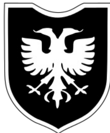
Stema e Divizionit SS Malor Skanderbeg

«Lidhja e Dytë e Prizrenit», V 1, N. 12, dt 4.VI.1944, f. 1